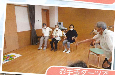
お手玉ダーツでレクリエーション