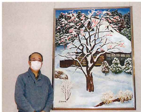
● 売間 信章 様より絵画7点寄贈