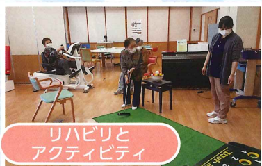
リハビリとアクティビティ