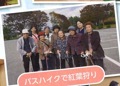
バスハイクで紅葉狩り