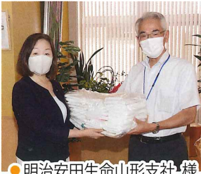
● 明治安田生命山形支社様