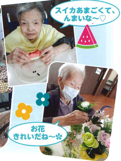
スイカあまごくて、んまいな~♡