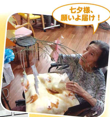
七夕様、 願いよ届け!