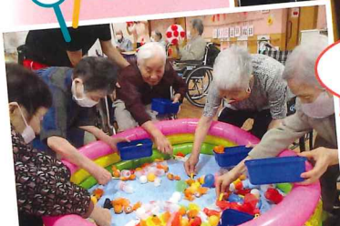
昔懐かし 金魚すくい