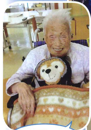
くまちゃん、 かわいいでしょ♡