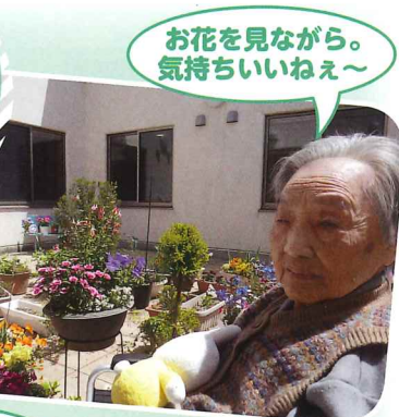
お花を見ながら。 気持ちいいねえ~