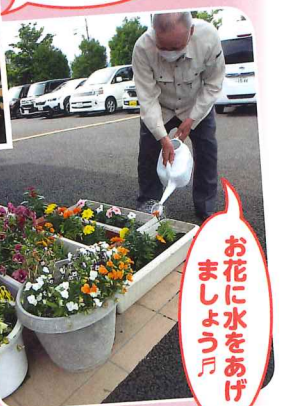
お花に水をあげ ましよう月