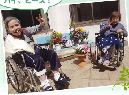
お花を見ながら。 ハイ、ピース!