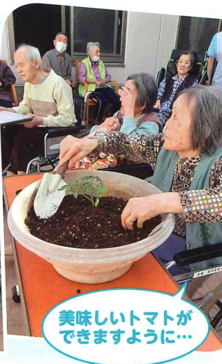
美味しいトマトができますように...