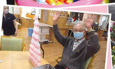
ピルクルタワー 万歳