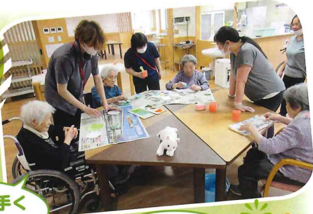
アジサイ上手く できたかな。