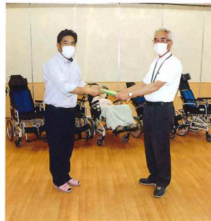
(株)高木様、黒澤建設工業(株)様、東北電化工業(株)様より車いす寄贈