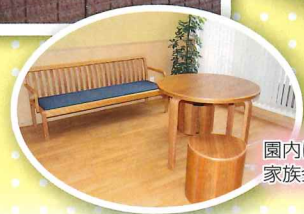
園内にあった桜の木を利用。家族会様よりいただきました。