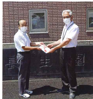
寒河江工業高校寒河江南地区PTA 様より白タオル 100 枚寄贈