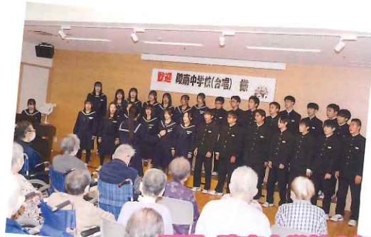
慰問・陵南中学校3年1組様