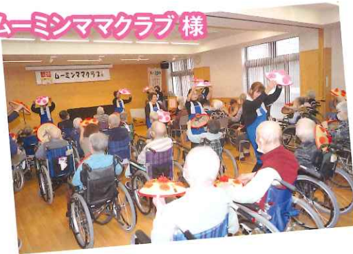
慰問・ムーミンママクラブ様