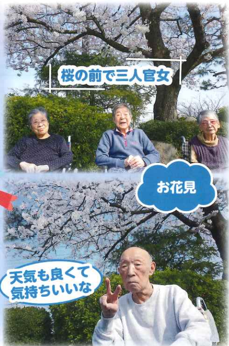
天気も良くて 気持ちいいな