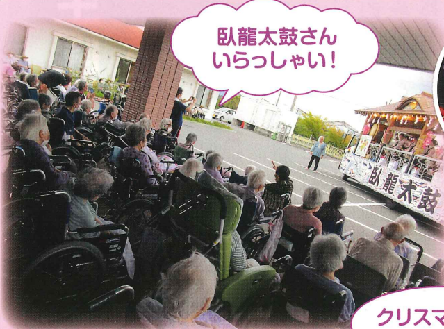
臥龍太鼓さん いらっしゃい!