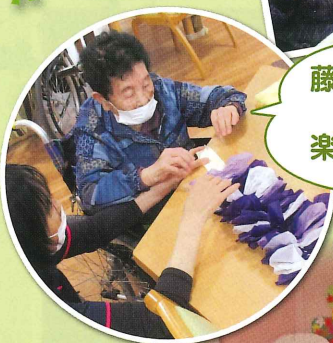
藤の花作り 完成が 楽しみだなあ~♪