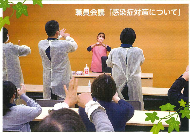
職員会議「感染症対策について」