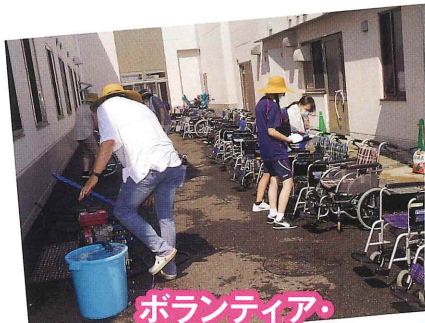
ボランティア・寒河江工業高校南地区PTA様