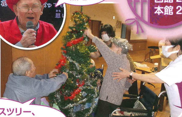
クリスマスツリー、 上手に飾れるかな?