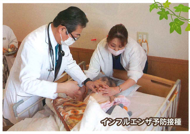
インフルエンザ予防接種

お風呂に入るときに、体が冷え切っている状態で高温のお風呂に入ると、血圧の乱高下により、心臓に負担がかかります。最悪の場合、死に至るケースもあるので、ヒートショックには十分注意しましょう。脱衣所をあらかじめ温めておく、湯船の温度を高くしすぎない（40℃～41℃が最適です）、入浴前に少なくともコップ1杯の水分を摂る。入浴中に汗をかいて、体の水分が少なくなると血液がドロドロになり、血管が詰まりやすくなります。いきなり湯船に入らずに、心臓に遠い手足などからゆっくりかけ湯をし、ある程度体を慣らしてから湯船に浸かるようにしましょう。